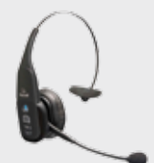
■ 94ACC0127 Bluetooth Headset VX1 B350-XT